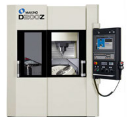
D200Z – Vertikales 5-Achs-Bearbeitungszentrum

hyperMILL® Perfekt. Präzise. Programmieren.