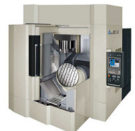
D800Z – Vertikales 5-Achs-Bearbeitungszentrum

Anmeldung www.openmind-tech.com/de/workshop-Makino/