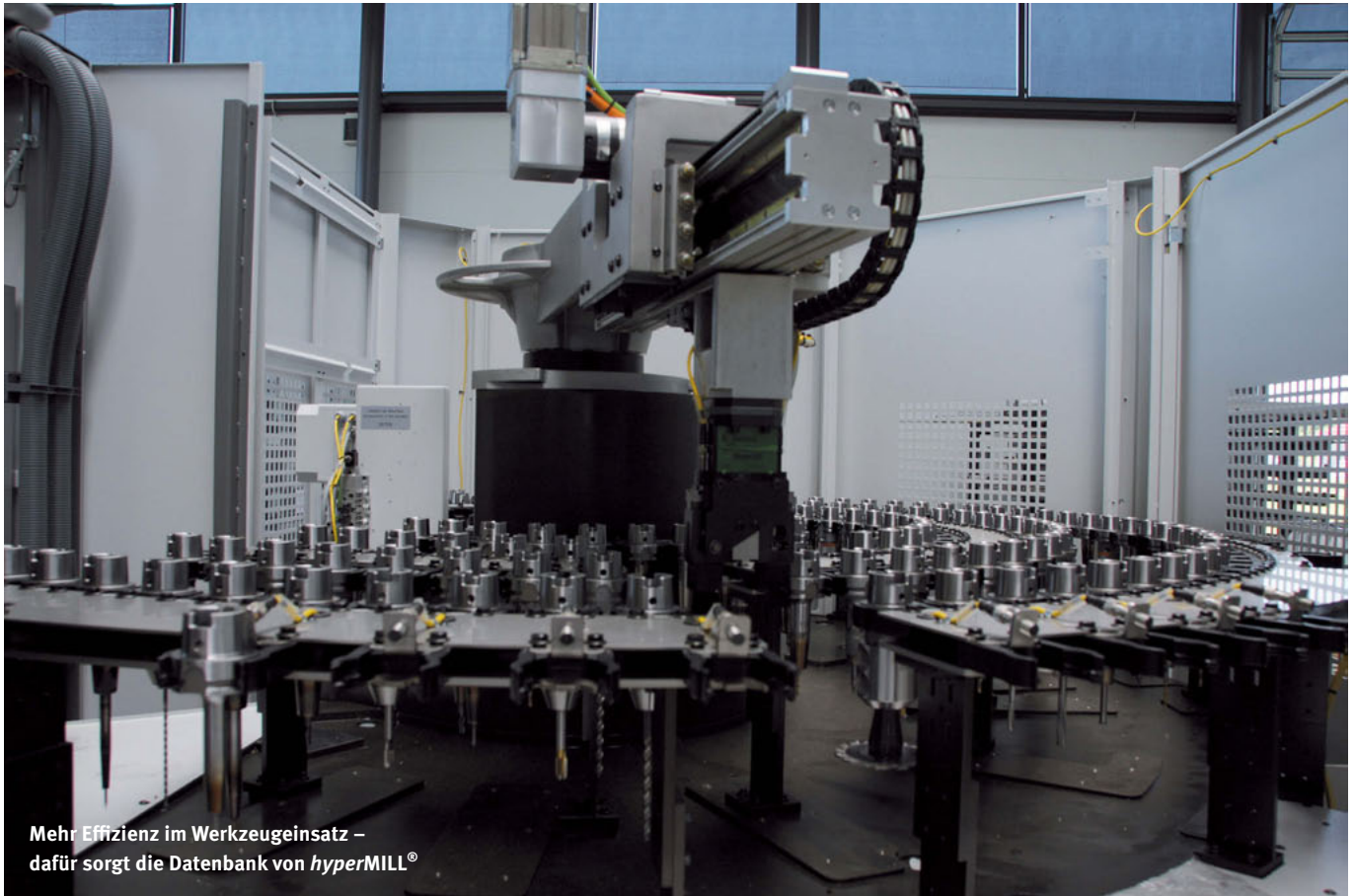
Mehr Effizienz im Werkzeugeinsatz – dafür sorgt die Datenbank von hyperMILL ®